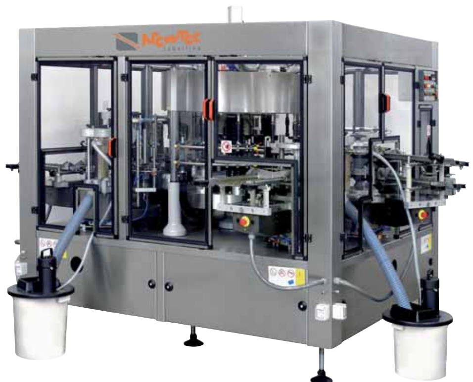
Leopard FIX + AD